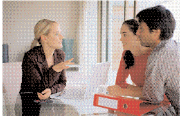
Gerade angehende und junge Beamte sind gut beraten, wenn sie für den Fall der Dienstunfähigkeit vorsorgen.

Die Beamtenversorgung gerät immer mehr unter Druck. Grund: Auch sie leidet unter den demographischen Faktoren – bei zunehmender Lebenserwartung und sinkenden Geburtenraten werden Pensionen die Kassen des Bundes und der Länder immer mehr belasten. Auch beim Thema Dienstunfähigkeit können sich vor allem junge Staatsdiener nicht sorgenfrei zurücklehnen. Da hilft nur eines: selbst privat vorsorgen!