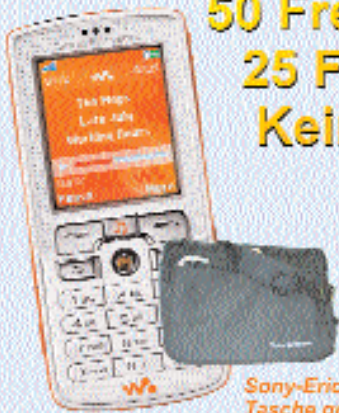
Sony-Ericsson-Tasche gratis dazu!

6 Monate kein Grundpreis* 50 Freiminuten im Monat* 25 Frei-SMS im Monat* Kein Anschlusspreis*