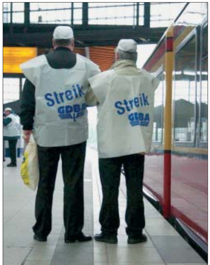
Wir streiken, für einen akzeptablen Tarifvertrag bei der S-Bahn Berlin.

Darüber hinaus hatte sie eine Absenkung der Arbeitszeit von 38 auf 36 Stunden pro Woche ohne Lohnausgleich verlangt. Die Verkehrsgewerkschaft GDBA, die Gewerkschaft Transnet und die GDL hatten unter anderem eine Einkommenserhöhung von 3,2 Prozent gefordert. Die Verhandlungen waren insofern gescheitert.